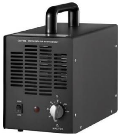
Ozongenerator. Fabrikatet har ingen koppling till texten

manent oxidera organiska föreningar, luktämnen, bakterier, mögel, virus etc.) på molekylär nivå... Ozonet når alla lukter, inte bara i luften, men ännu viktigare vid dess källa. ... I en snabb reaktion, attackerar och neutraliserar ozonet de luktframkallande ämnena vilket gör dem helt luktfria... Ozon som inte kan hitta en lukt att reagera med återgår till vanligt syre efter cirka två timmar... I apparatens automatläge tar behandlingstiden enbart hänsyn till ytan hos utrymmet. I manuellt läge kan man ändra både tid och effekt men det "sker på egen risk"!